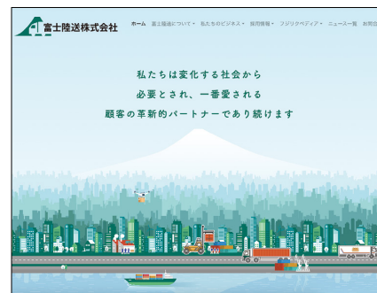
富士陸送株式会社のホームページ

今後も社員のITリテラシーの向上を図りながら、『SMILE V2トラックスター』を活用して、さらに業務効率を高めていく考えだ。