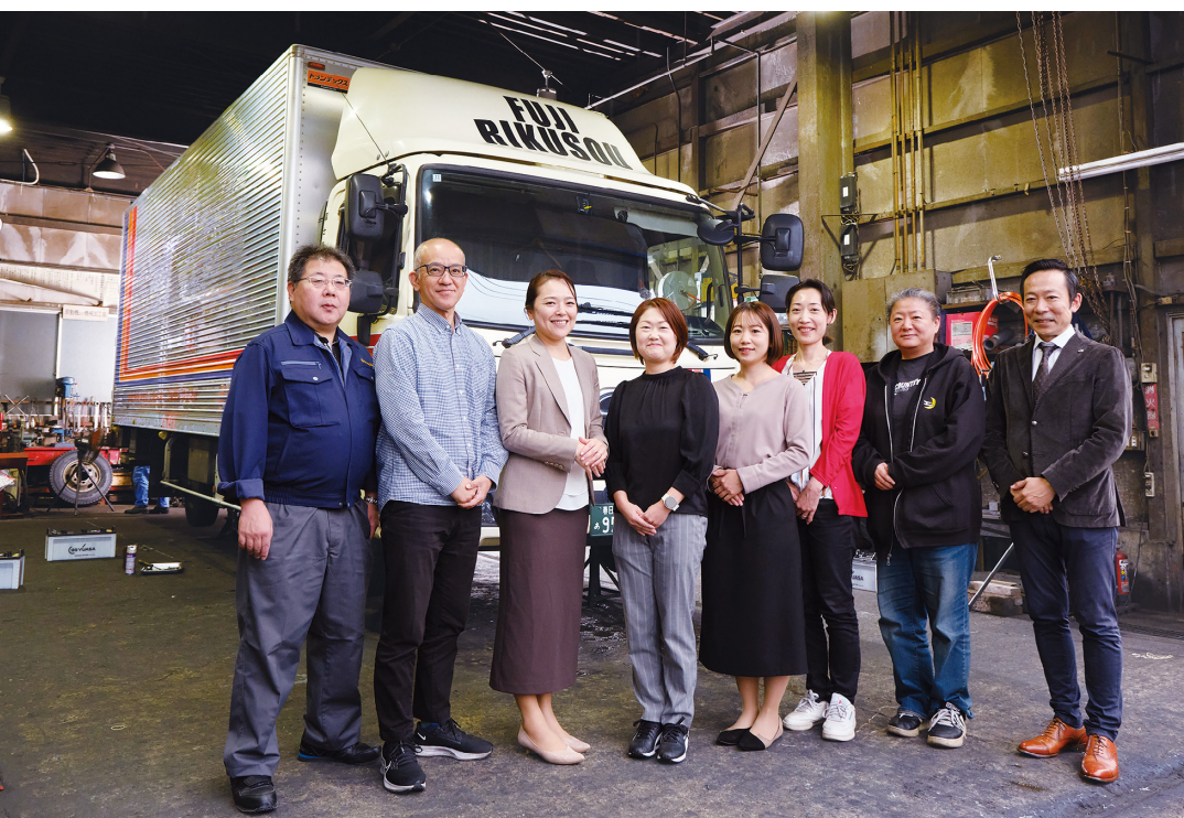
『SMILE V 2nd Editionトラックスター』がドライバーや経理の業務負担軽減に寄与している

東京都大田区に本社を構える富士陸送株式会社は、食品輸送と海上コンテナの陸送事業という二本柱で、きめ細かな物流サービスを提供している。物流業務に関わる事務作業のデジタル化を積極的に推進する同社は、運送業向け販売システム『SMILE V 2nd Editionトラックスター』と、車両に設置したデジタルタコグラフのデータ連携を実現。これまでドライバーが手書きで行っていた運転日報の作成をほぼ自動化し、経理担当者のデータ入力時間も半減させる先進的な取組を実践している。