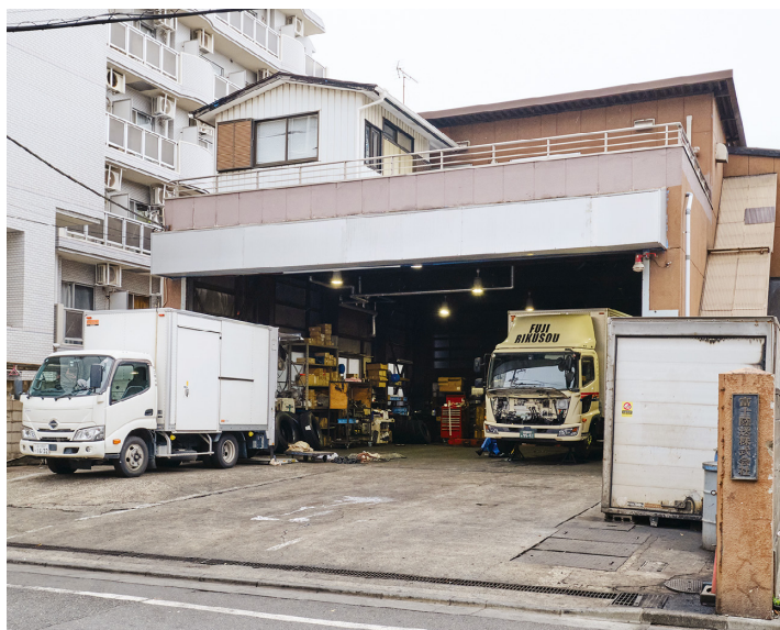
車両整備部門を併設する本社。社名プレート(写真右下)は創業時から変わらない

ドライバー不足や高齢化など、物流業界を取り巻く人材環境は厳しい。加えて、2024年4月からは、ドライバーの時間外労働時間の上限が年