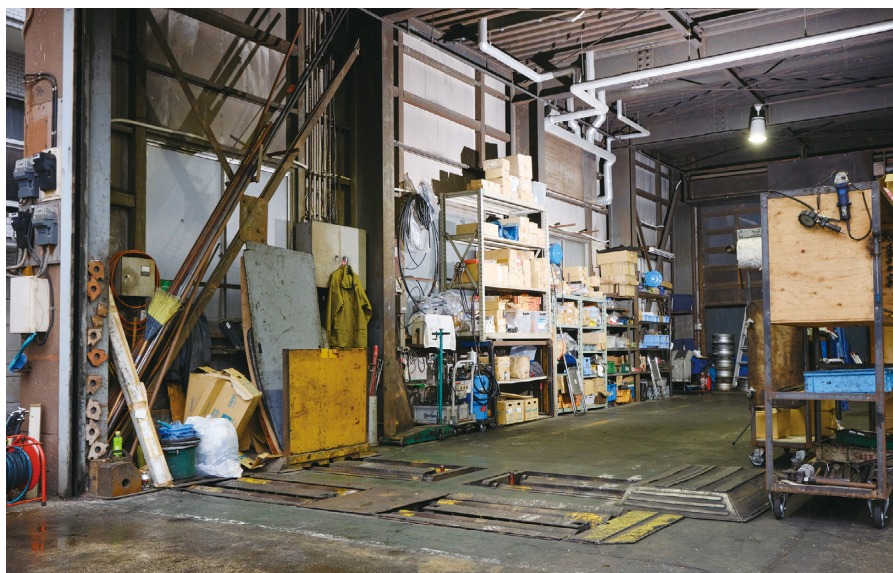
車両整備部門では3名の自動車整備士が車両の整備に当たり、事故の未然防止に努めている

2022年6月、富士陸送は食品輸送事業向けに『SMILE V2トラックスター』を導入した。その最大のポイントは、デジタルタコグラフ(以下、デジタコ)とのデータ連携を行い、運転日報の入力作業をほぼ自動化したことである。